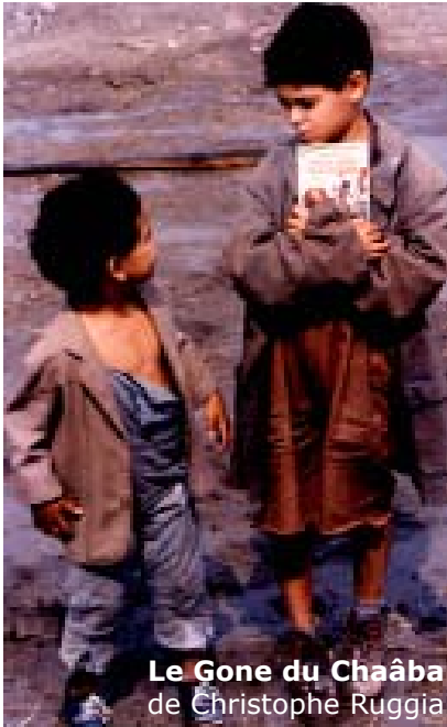
Le Gone du Chaâba de Christophe Ruggia

«L'ambition de la mission pédagogique de notre manifestation demeure la découverte de véritables oeuvres cinématographiques , la connaissance, la compréhension de faits historiques jusque dans leurs répercussions actuelles , et enfin la rencontre, souvent passionnante avec des personnalités susceptibles d'aiguillonner la réflexion des élèves. »