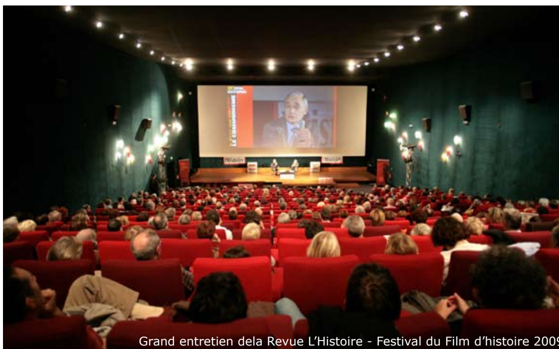
Grand entretien de la Revue L'Histoire - Festival du Film d'histoire 2009