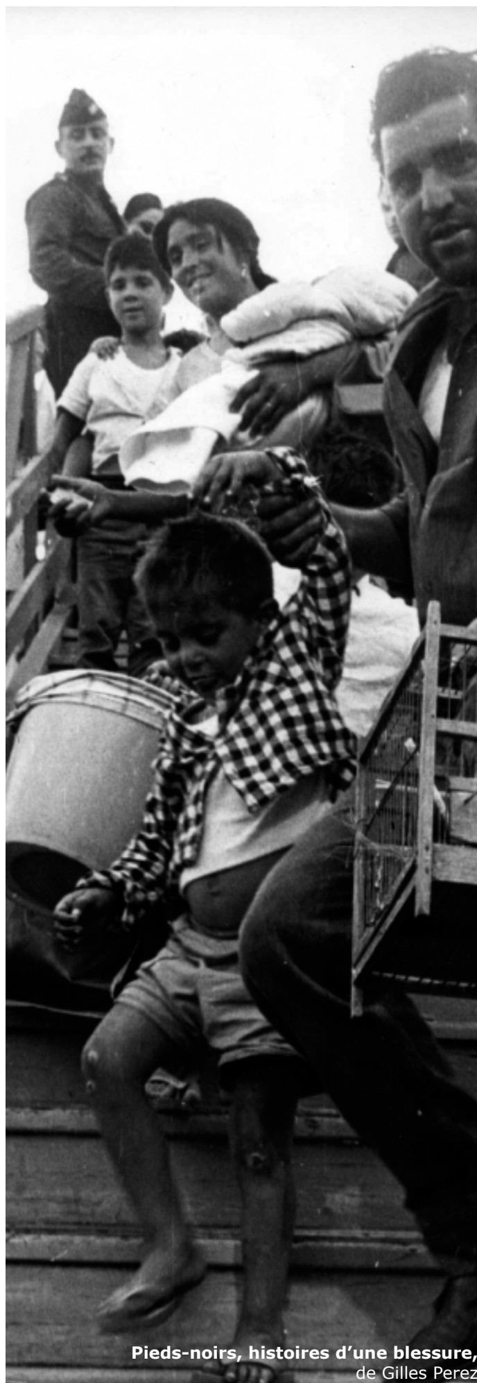
Pieds-noirs, histoires d'une blessure, de Gilles Perez