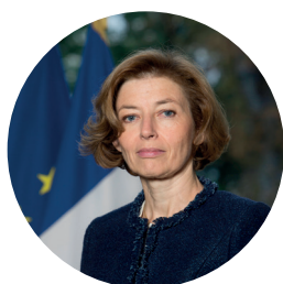
Florence Parly Ministre des Armées

Ces six priorités, au cœur de la boussole stratégique, poursuivent un objectif : mieux protéger les Européens, mieux défendre leurs intérêts et porter au plus haut leurs valeurs.