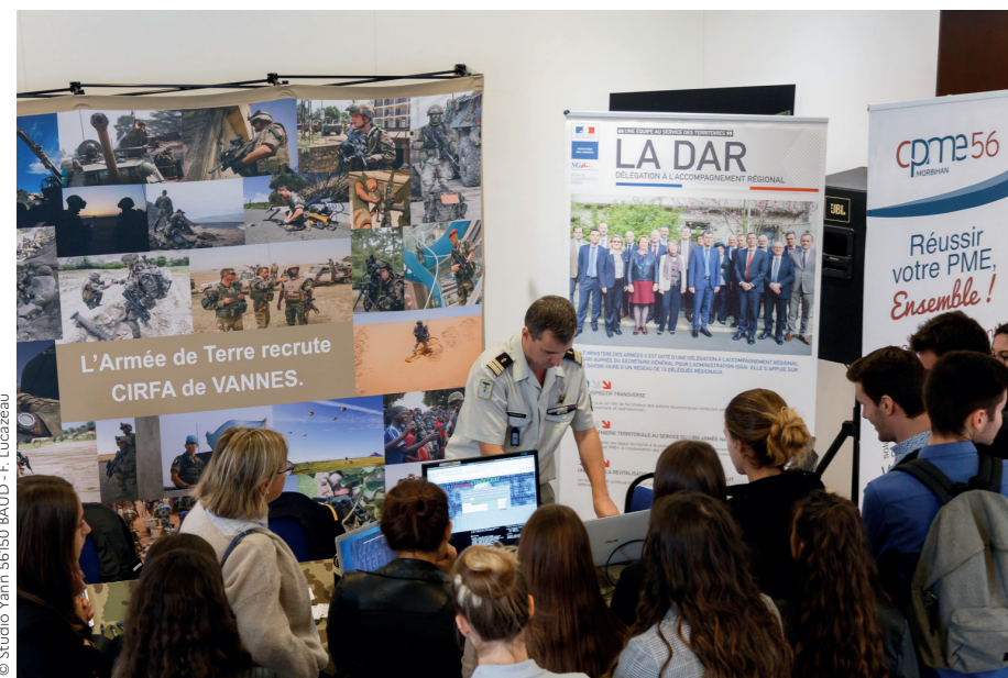
Premier « salon de la PME connectée » organisé à Vannes (CPME et Rotary Club).

PME et ETI fournisseurs directs (chiffres 2020)