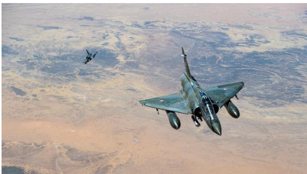
Task Force Takuba : des opérations d'envergure aux côtés des Européens et des Maliens