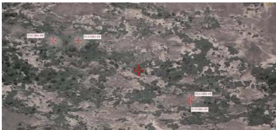
TF TAKUBA : une dynamique européenne bien en marche et des unités des forces armées maliennes (FAMa) qui progressent