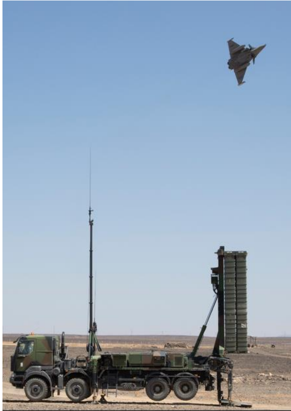
Nouvel entraînement conjoint des avions de chasse français et irakiens