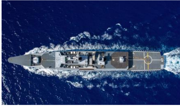
Exercice franco-algérien RAIS HAMIDOU 2021