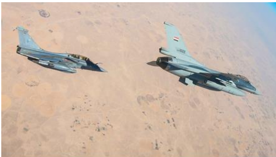
Fin de mission pour l'ATL2