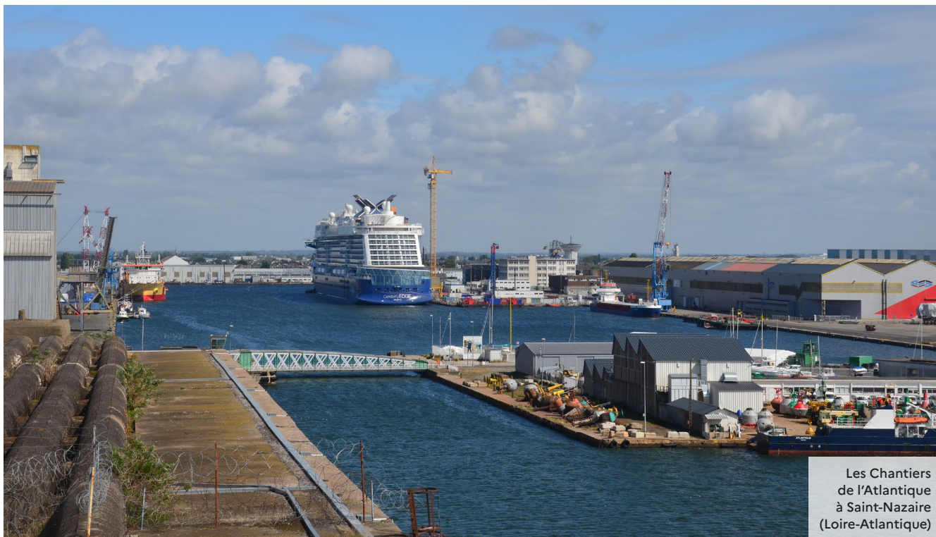
Les Chantiers de l'Atlantique à Saint-Nazaire (Loire-Atlantique)