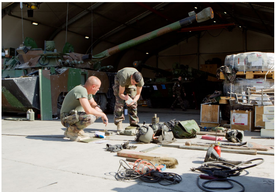
Neopolia mobilisée au profit du MCO terrestre.

Les rencontres ultérieures lors du Forum Entreprises Défense 2019, au sein des BSMAT à Neuvy-Pailloux, Yzeure et Tulle et le travail de faisabilité quant à la résolution de divers cas d'obsolescence pour trouver une solution d'approvisionnement ou de remise en configuration opérationnelle ont confirmé l'apport de Neopolia qui se positionne sur la réalisation de prestations unitaires ou de petites séries, que ce soit en usinage, en fabrication additive en mécano-soudure ou en traitement de surface.