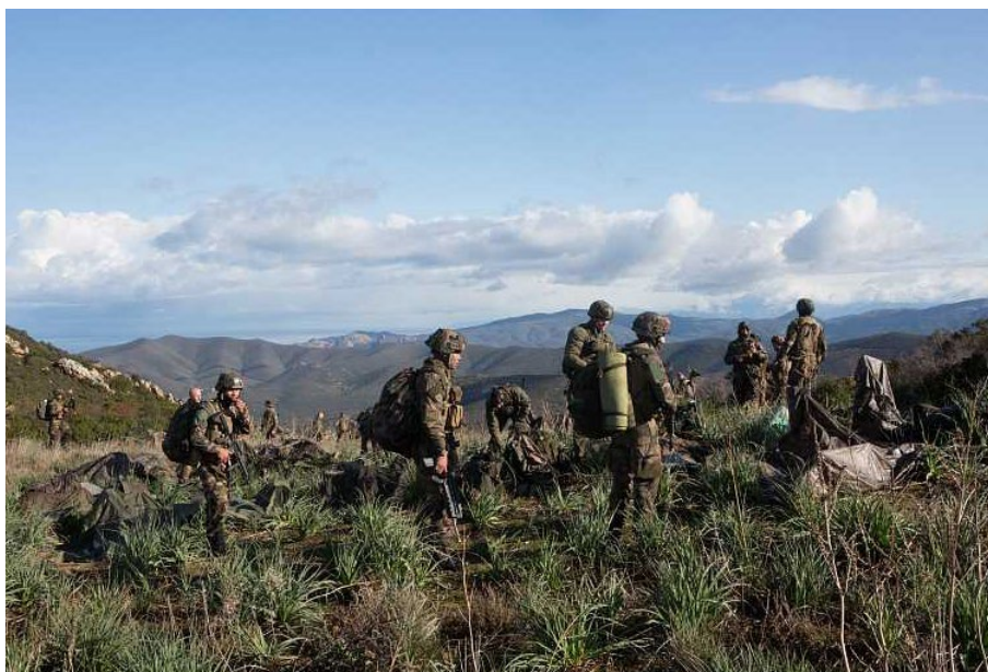
Exercice Altor Balanina du 2 e REP (régiment étranger de parachutistes) de Calvi en Corse. 2018.

7 sémaphores de la Marine Nationale qui assurent la surveillance du trafic maritime