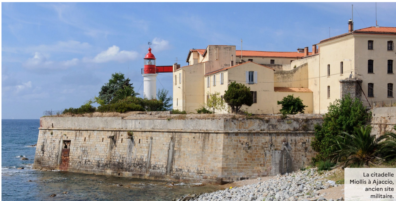
© DAR Corse - P. Ricard