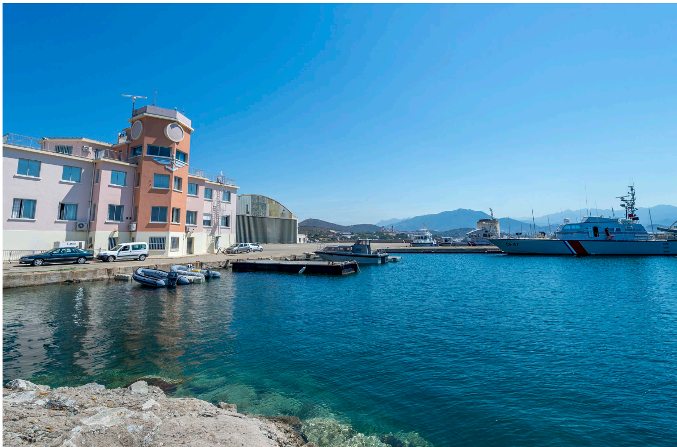
Base navale d'Aspretto.