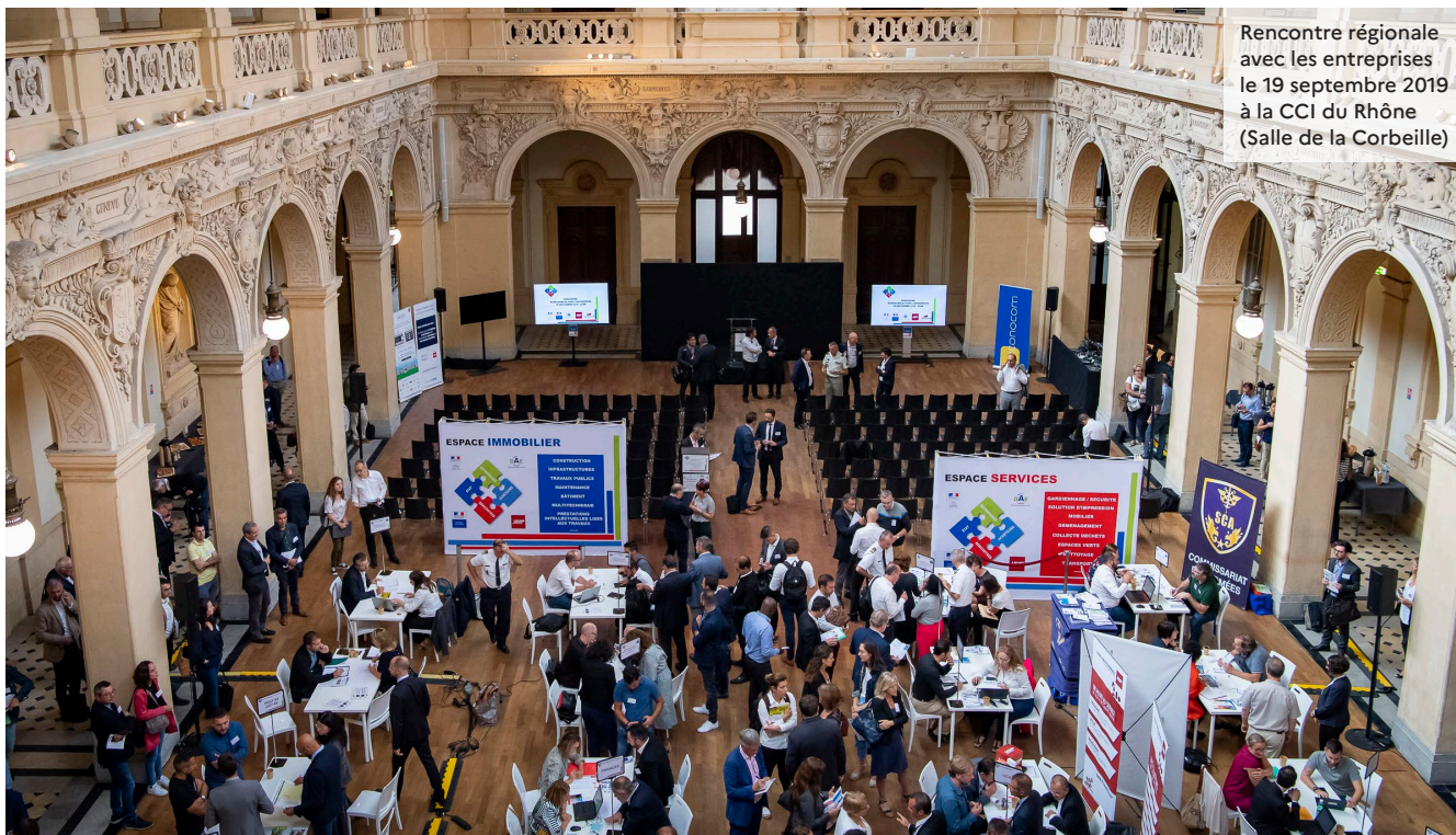
Rencontre régionale avec les entreprises le 19 septembre 2019 à la CCI du Rhône (Salle de la Corbeille)