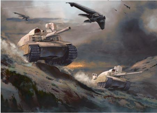
Abolition des distances et du temps @Amaury Bündgen

L'initiative Red Team est un exercice de prospective innovant. L'objectif ? Nourrir les réflexions stratégiques, opérationnelles, technologiques et organisationnelles du ministère des Armées. Ses travaux se répartissent en quatre saisons. Composée d'une dizaine d'auteurs et de scénaristes de science-fiction, l'équipe Red Team Défense est pilotée par l'université Paris sciences & lettres (PSL) et travaille étroitement avec des experts scientifiques et militaire.