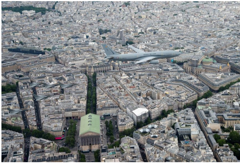
A330 Phénix et Rafale au-dessus de Paris lors de la répétition du 12 juillet 2021

Malgré une météo contraignante, le public a pu admirer près de 70 avions, défilant à moins de 300 mètres d'altitude, pour un spectacle aérien d'une dizaine de minutes. Un second défilé aérien, des voilures tournantes, a succédé au défilé des troupes au sol.