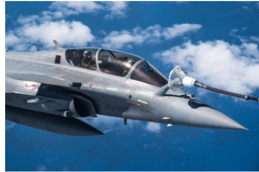
WAKEA : coopération de l'armée de l'Air et de l'Espace avec l'US Air Force à Hawaï