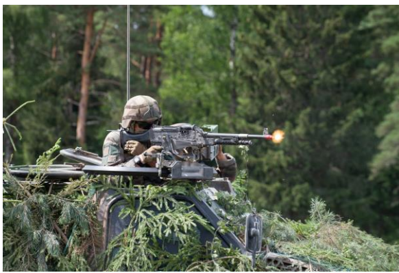
Europe du Nord et de l'Est - Mission Lynx 10 Lynx 10 : montée en puissance du Sous-groupe tactique interarmes