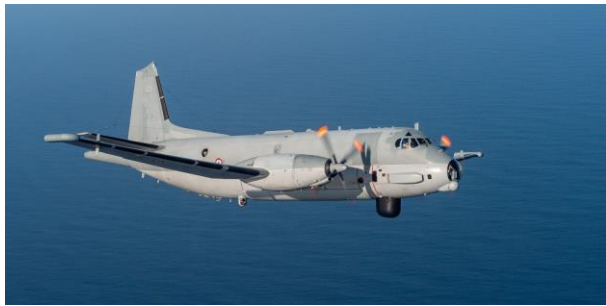
Premier vol opérationnel pour l'Atlantique 2