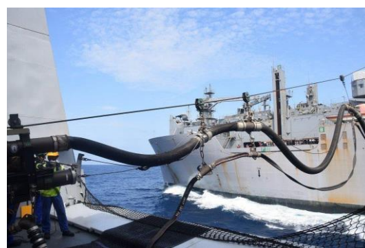
Exercices de coopération avec le Japon dans le golfe d'Aden