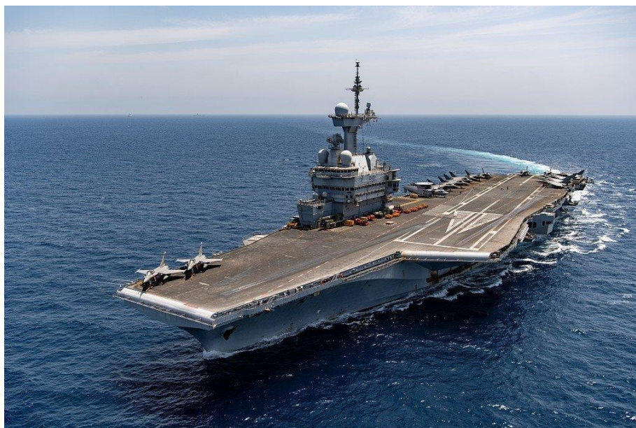
Projection de puissance vers la terre : des exercices grandeur nature à Djibouti