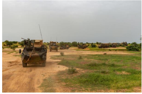
Relève du détachement du Scoutspataljon