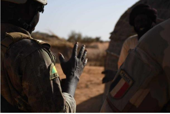
Relève pour le groupement tactique désert aérocombat