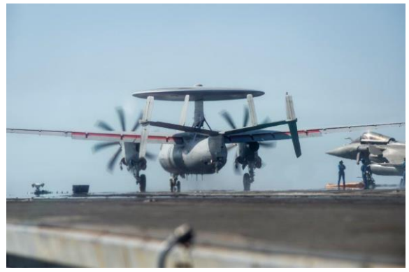
Big Fox : exercice de coopération bilatérale avec la Marine émirienne