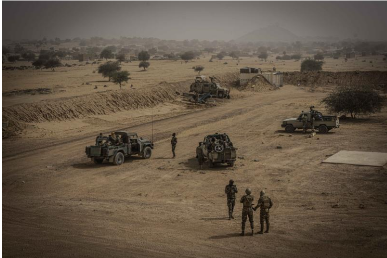
Don de matériels aux forces armées partenaires