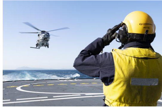
Début de mission pour le GEOM Jeanne d'Arc 2021