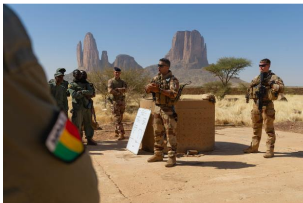
Relève à la tête du Groupement tactique désert (GTD) aérocombat