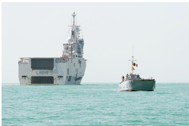
Le PHA Dixmude participe à l'exercice XARITOO 2021