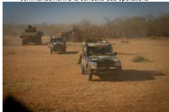
Le GTD Lamy en opération avec le 33 e RCP dans la région d'Hombori