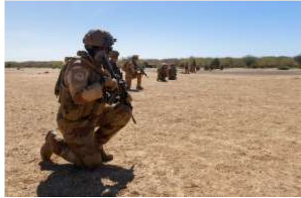
La TF Takuba poursuit ses opérations conformément à sa feuille de route