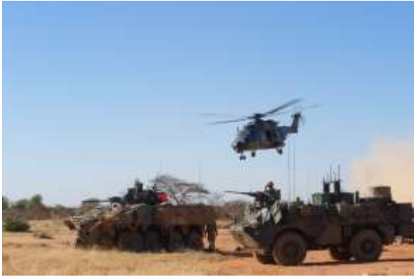
Le GTD Conti avec la FC G5 Sahel à la frontière malo-burkinabé