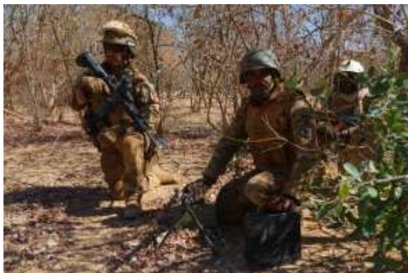
Une opération conjointe majeure d'un mois dans la zone des trois frontières

L'opération ECLIPSE : une opération d'ampleur, un haut niveau d'intégration au sol et dans les airs, du commandement à la conduite des opérations