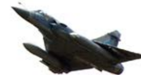
L'E-3F, en vol avec des Mirage 2000-5, est équipé de la liaison 16.