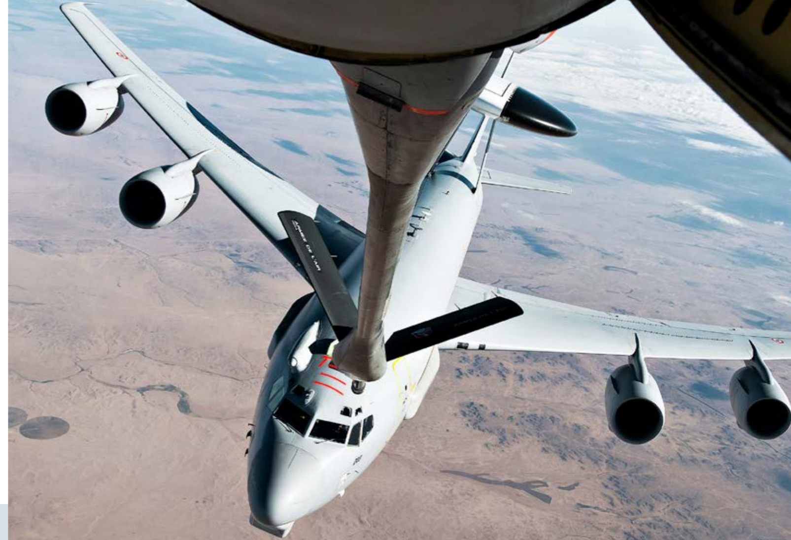
L'E-3F peut être ravitaillé en vol par les C135 et les A330 Phénix, ce qui lui permet d'avoir une autonomie de 18 heures.