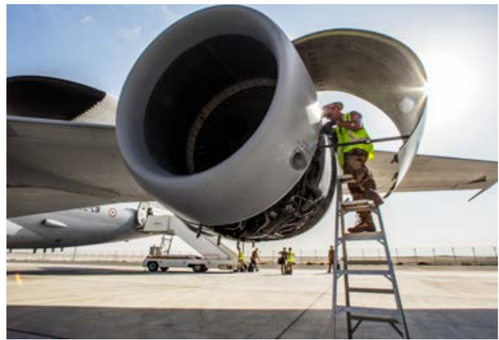
Un mécanicien motoriste effectue un dépannage sur l'aéronef.