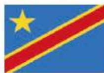
RÉPUBLIQUE DÉMOCRATIQUE DU CONGO