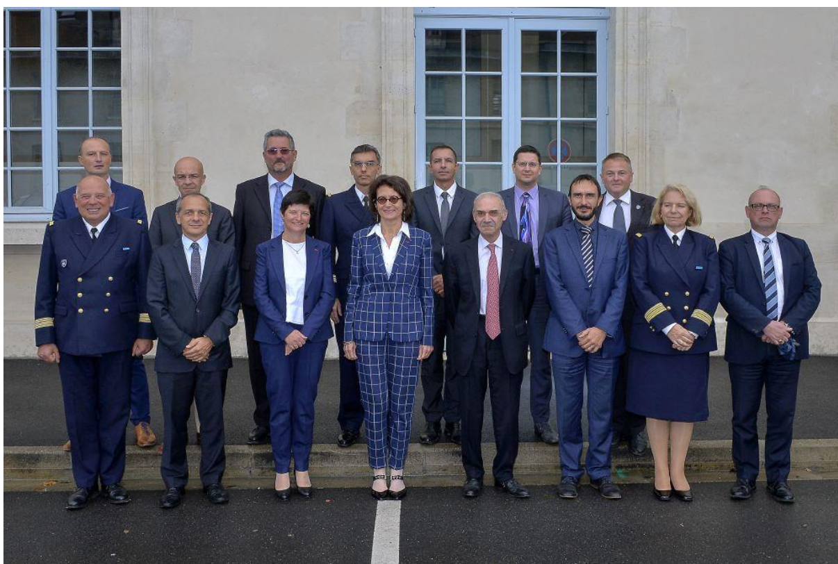
Septembre 2019, SGA, DAR, DAR adjoint et délégués régionaux © Jacques ROBERT.

Line Bonmartel-Couloume Cheffe de service, Déléguée à l'accompagnement régional