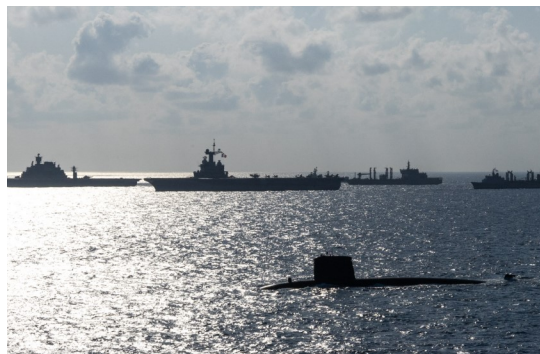
SNA AMETHYSTE DANS LE GAN