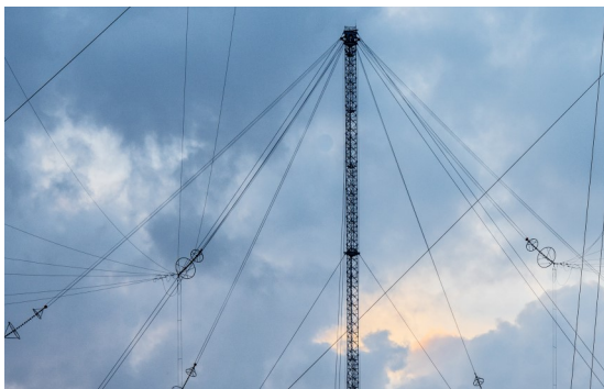
RETOUR DU CTM ROSNAY DANS LE CYCLE

La vidéo des vœux 2020 d'ALFOST est disponible sur le portail des FSM : https://portail-alfost.intradef.gouv.fr