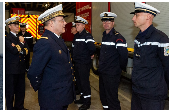
VISITE DU CEMM A L'ILE LONGUE