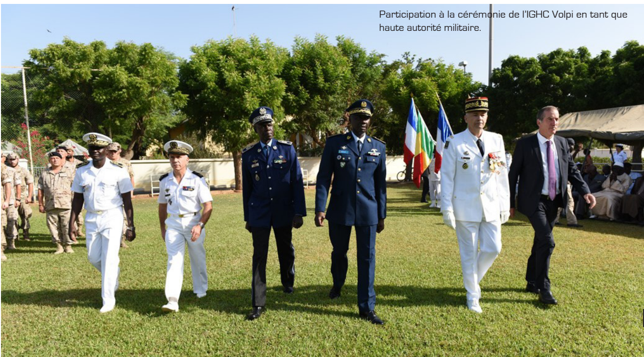
Participation à la cérémonie de l'IGHC Volpi en tant que haute autorité militaire.

Le troisième et quatrième jour de la visite ont été consacrés à la République de Côte d'Ivoire.