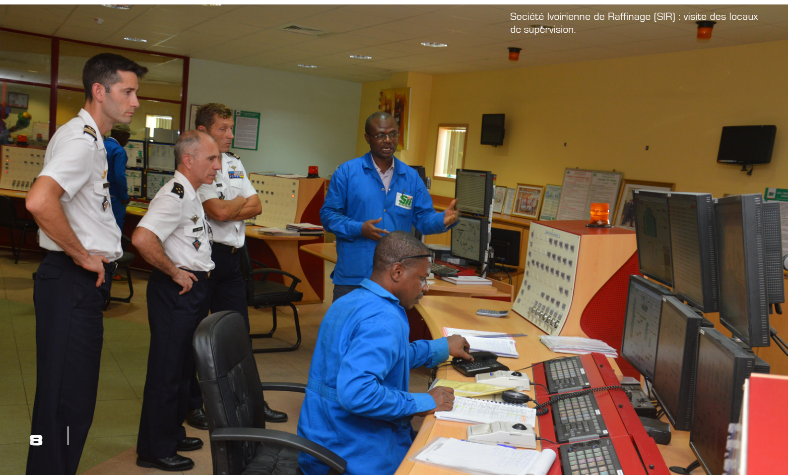
Société Ivoirienne de Raffinage (SIR) : visite des locaux de supervision.