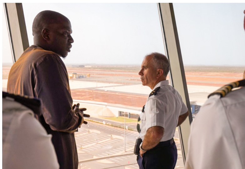
Explications concernant l'AIBD facilitées par la vue panoramique depuis la tour de contrôle.