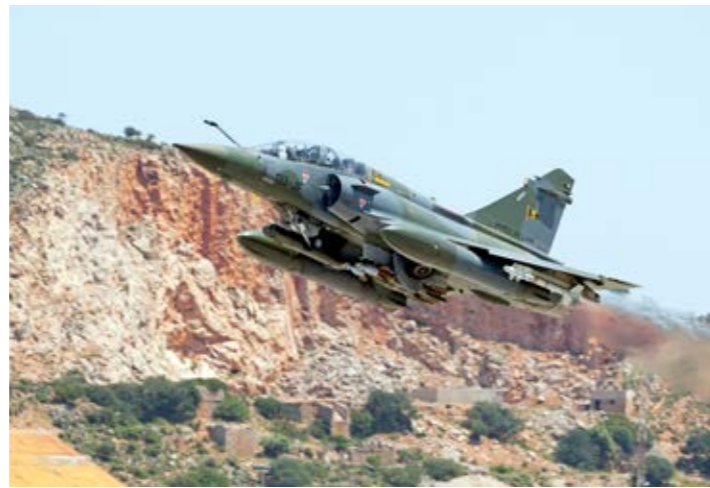
Mirage 2000 D participant à l'opération Harmattan en Libye.