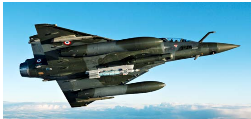
Mirage 2000 D armé d'une bombe à guidage dual GPS et laser GBU49.