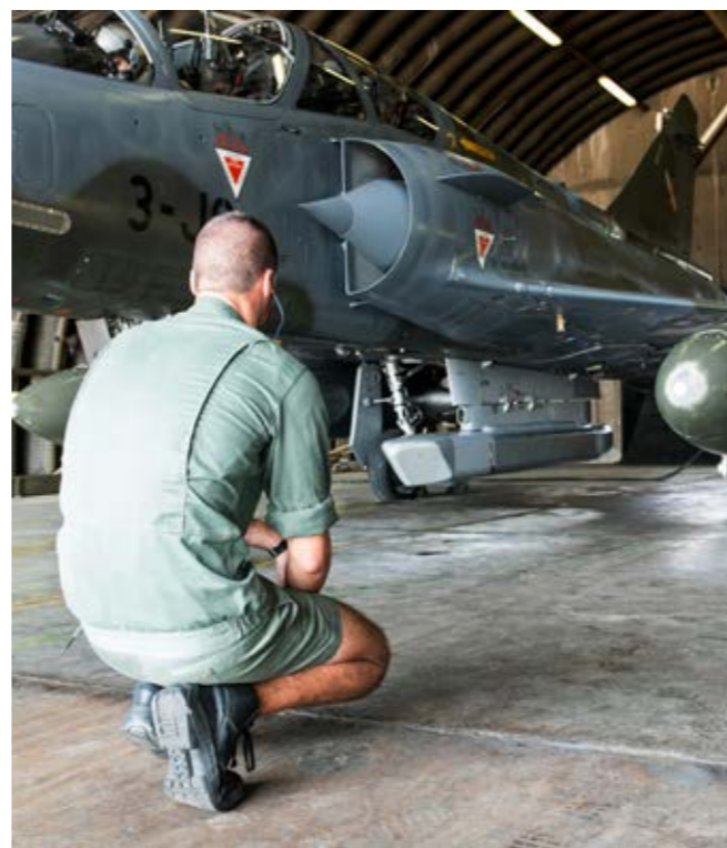
Un mécanicien vient d'équiper le Mirage 2000 D de la nacelle ASTAC.

est amélioré pour compléter le système de navigation et d'attaque (SNA) du Mirage 2000 D. Cette mise à niveau n'est toutefois pas suffisante pour pérenniser les capacités de l'aéronef. C'est pourquoi une opération de rénovation à mi-vie a été lancée. Elle permettra au Mirage 2000 D de poursuivre sa participation à la tenue des contrats opérationnels en complément du Rafale jusqu'au-delà de 2030. Ce chantier de modernisation vise à remplacer les missiles air-air Magic II par des Mica IR, mais également à intégrer le canon DEFA 550 F3 dans un pod monté au point de fuselage latéral avant gauche de l'avion afin d'offrir une capacité supplémentaire à l'Armée de l'air pour les missions de Close Air Support (CAS - appui aérien rapproché). Par ailleurs, un des objectifs de la rénovation est aussi de traiter des obsolescences, comme celle du PC embarqué SCARABEE, qui permet une meilleure coordination air-sol. Enfin, les systèmes de simulation de vol seront mis à niveau.