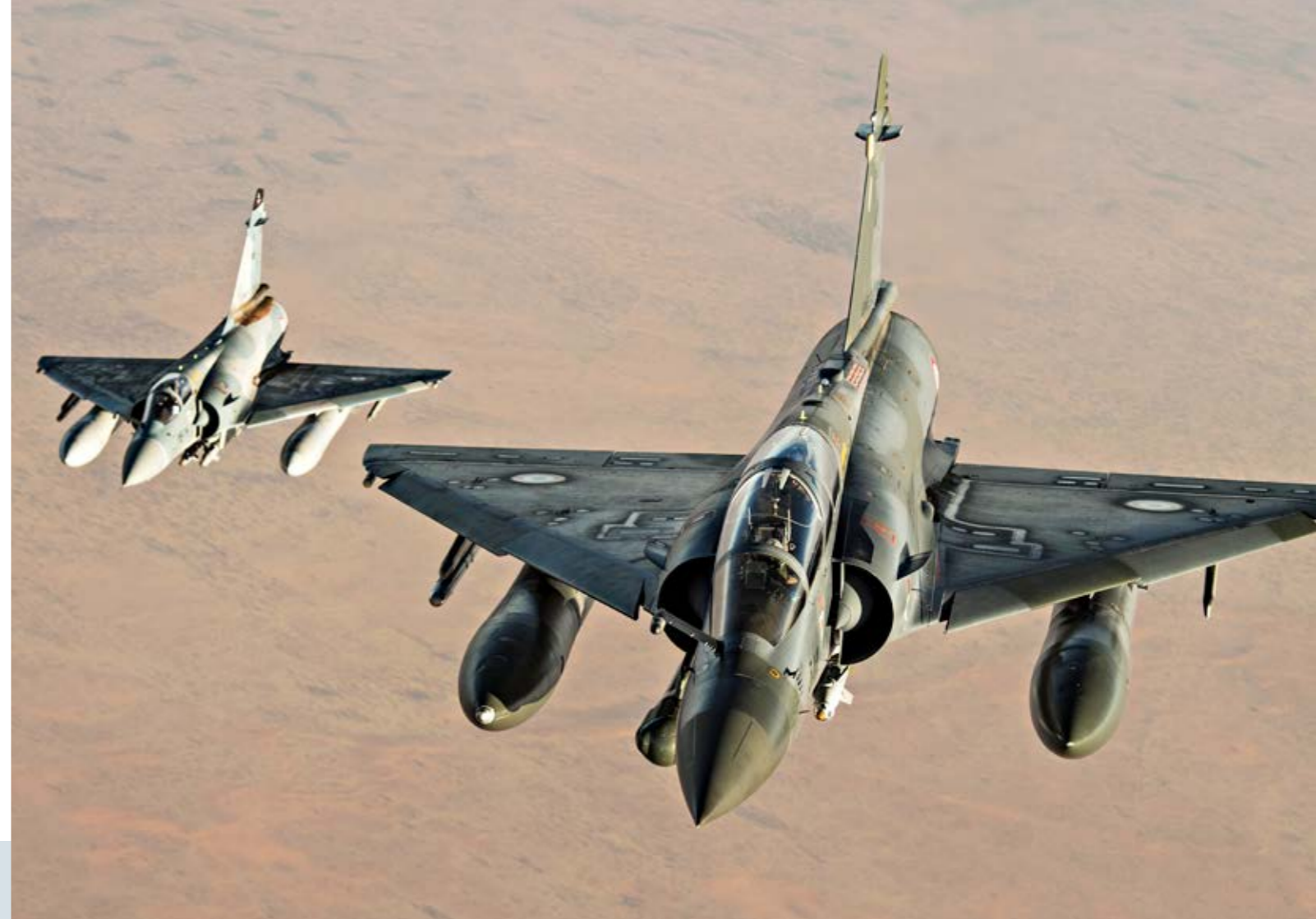
Un Mirage 2000 D et un Mirage 2000 C dans la bande sahélo-saharienne dans le cadre de l'opération Barkhane .