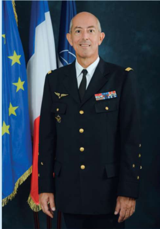
Général d'armée aérienne Philippe LAVIGNE Chef d'état-major de l'Armée de l'air

Le général d'armée aérienne Philippe Lavigne est chef d'état-major de l'armée de l'air française depuis le 31 août 2018.