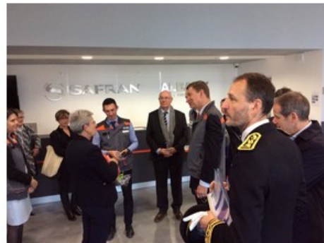
Le Plan famille