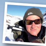
Médecin de réserve G.

“ La réserve me permet de rester à jour sur les dernières techniques et de toucher à tout. Au cabinet je vais désormais beaucoup plus vite, je suis beaucoup plus efficace. Au niveau humain et professionnel, c’est un enrichissement immense qu’il ne faut absolument pas manquer.