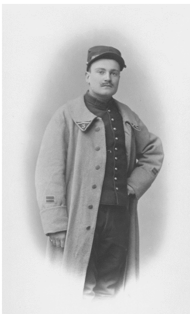
Fig. 2 : Ce brigadier du 3 e régiment d'artillerie vient de percevoir son manteau bleu horizon. Les armes d'appui ne sont dotées dans un premier temps que du manteau ou d'une capote de la nouvelle couleur. La priorité demeurerait l'infanterie.