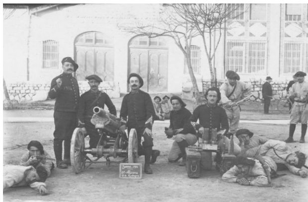
Fig. 3 : Ces artilleurs du 2 e régiment d'artillerie de montagne de Nice miment ce qui pourrait être un de leurs premiers engagements en cette campagne de 1914. Le canon de 65mm de montagne est prévu pour être monté à dos de mule ou d'homme.