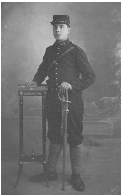
Fig. 1 : Bien que portant un uniforme d'avant-guerre, ce cliché a bien été pris au début du conflit. Cet artilleur du 47 ème régiment d'Héricourt porte des bandes molletières en lieu et place des jambières de cavalerie.