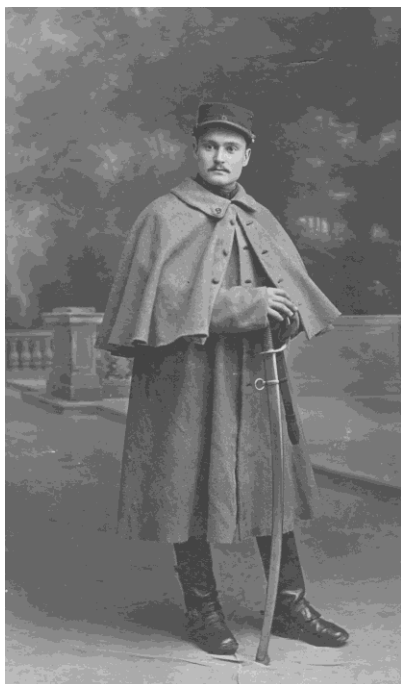
Fig. 5 : Artilleur du 9 e régiment d'artillerie de Castres, en 1914, en tant que conducteur d'attelage, il porte le manteau des troupes montées.