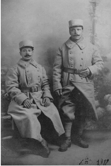
Fig. 3 : Sapeurs du service des chemins de fer militaires en 1918, ce sont des employés des compagnies de chemin de fer : PLM, PO, Etat, Nord, Est et Midi. Leur spécialité est marquée par leur insigne de manche.