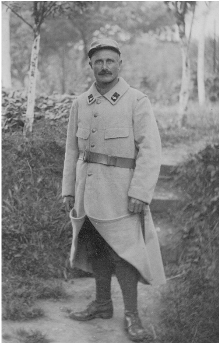
Fig. 4 : Sapeur du 4 e bataillon de réserve du génie vers 1915/16.