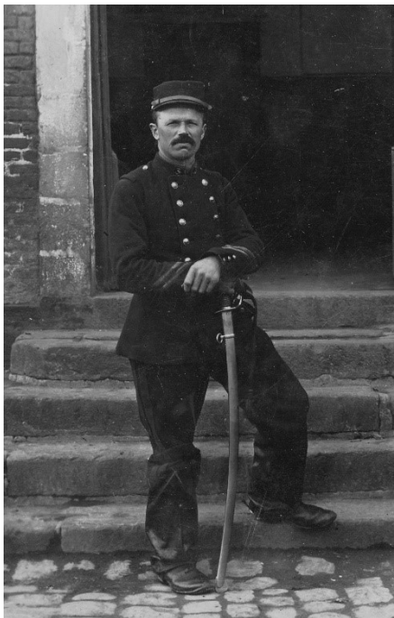
Fig. 2 : Sapeur du 3 e régiment de génie d'Arras avant 1914. Sa fonction de conducteur fait qu'il porte une tenue de troupe montée.