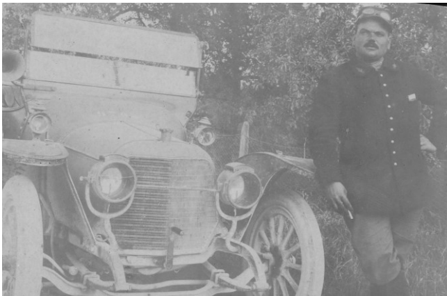
Fig. 1 : Posant fièrement devant son auto, ce conducteur du service automobile porte en complément de sa tenue des lunettes de protection.