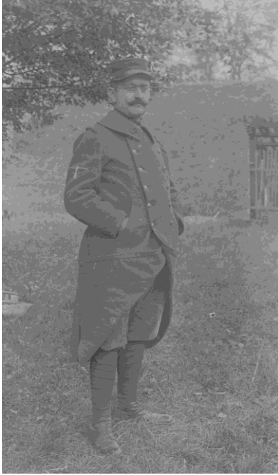
Fig. 3 : Soldat du 2 e régiment d'aéronautique vers 1915. Il porte l'insigne distinctif de son arme sur le bras droit, la loi du 12 mars 1912 consacre l'aéronautique comme une arme à part entière.