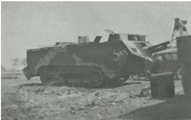
Fig. 4 : Char Saint-Chamond.