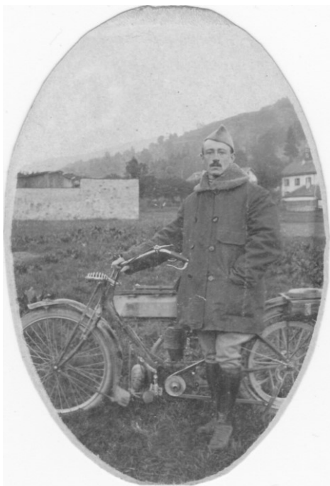
Fig. 2 : La veste canadienne était de rigueur pour ses pionniers motocyclistes militaires. Bien que non réglementaire, elle était tolérée vu les conditions d'exercice de leur mission par les estafettes.