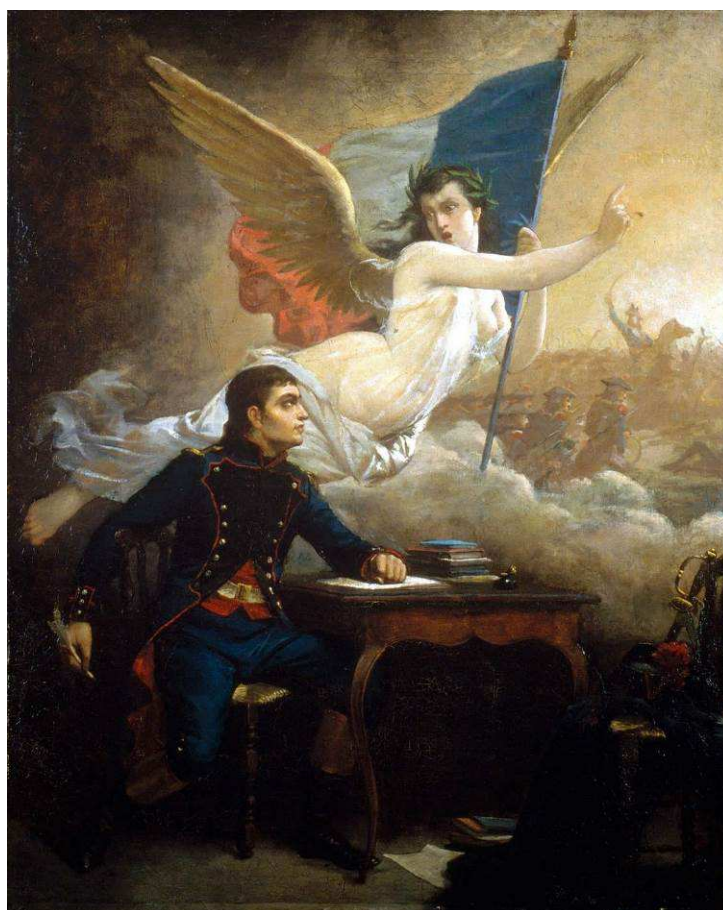
Rouget de Lisle composant La Marseillaise (Auguste Pinelli)