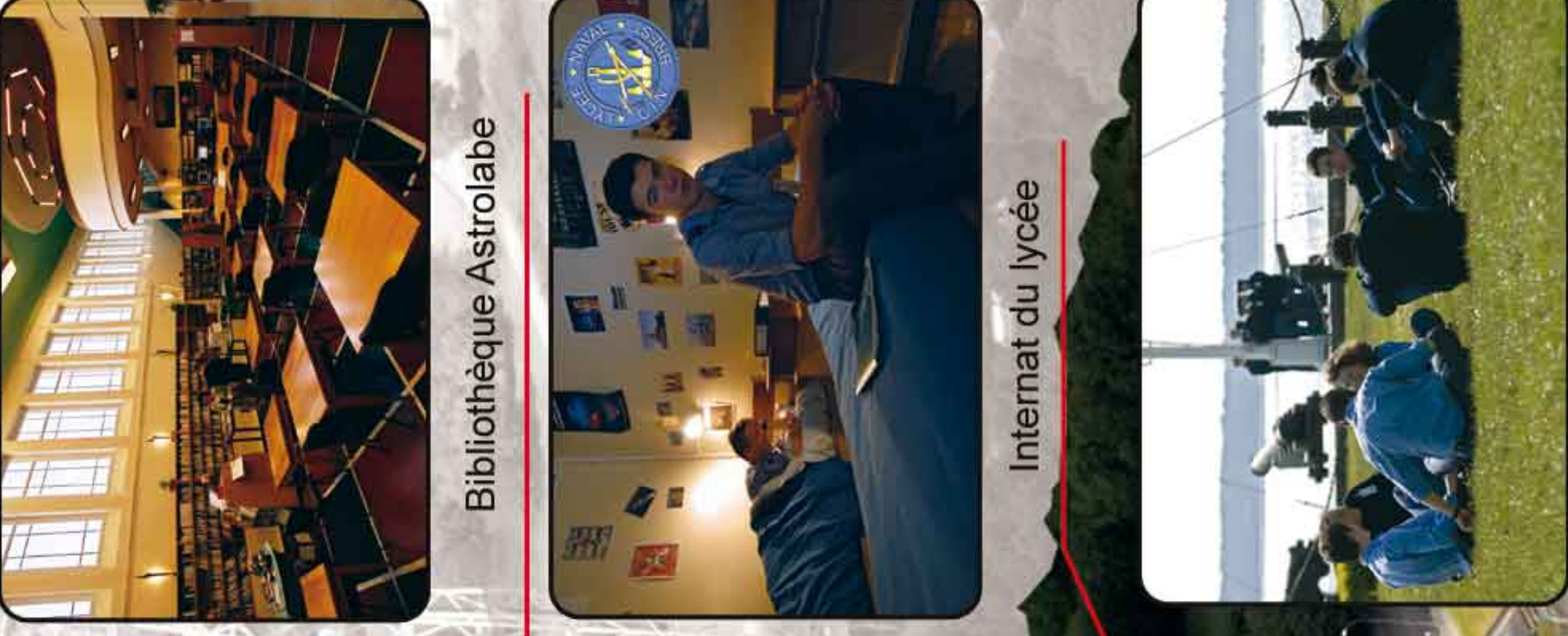
Front de mer