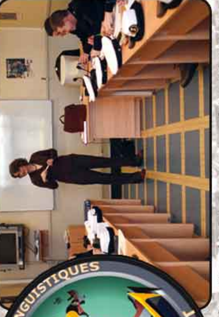
Centre de Ressources Linguistiques - Laboratoires de langue