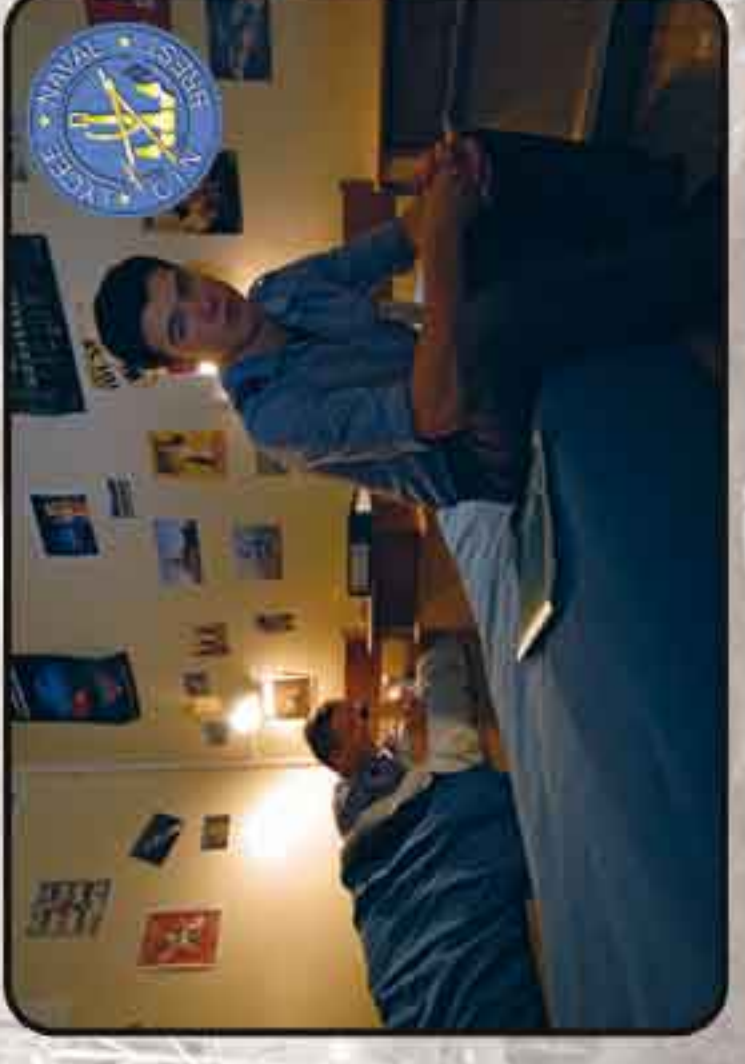
Internat du lycée