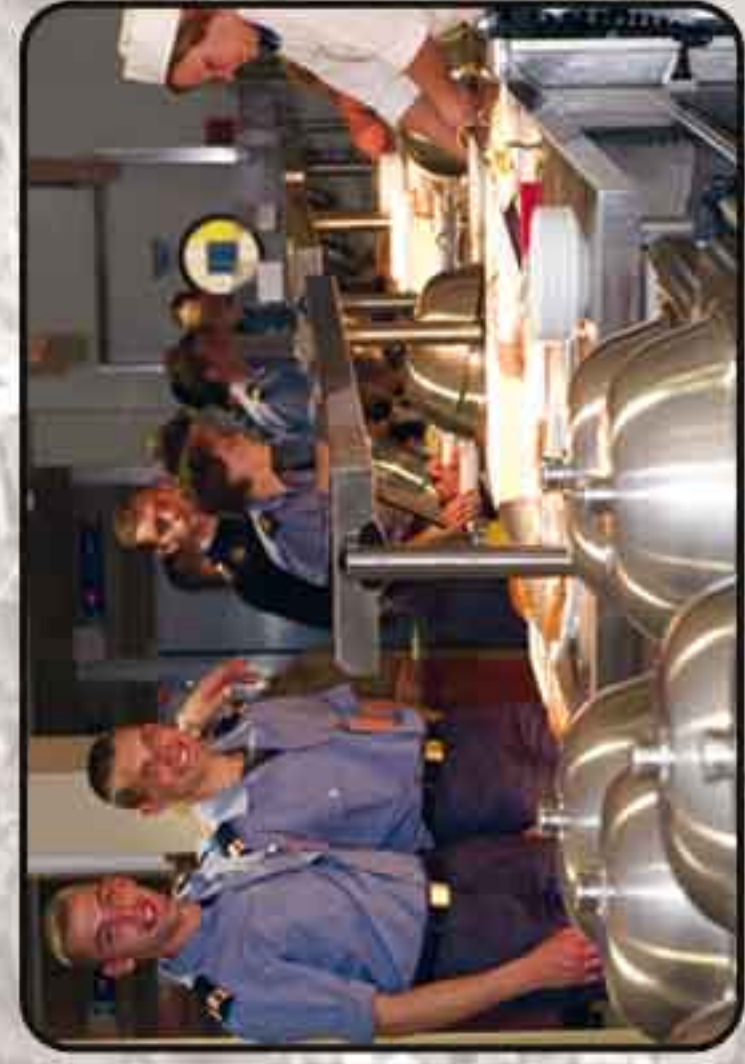
Restauration - Foyer