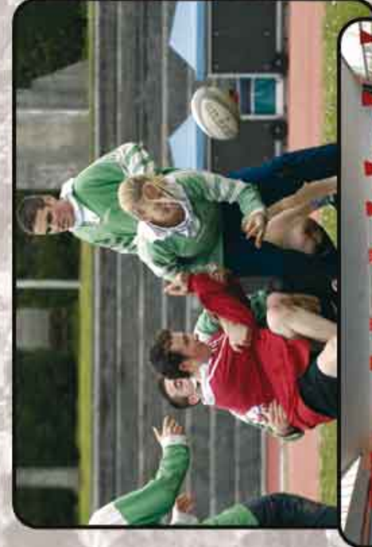
Stade - Piscine