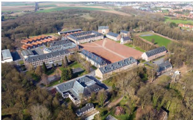
La citadelle Vauban et la communauté urbaine d'Arras.

Des projets structurants et des aides directes aux entreprises pour permettre leur installation