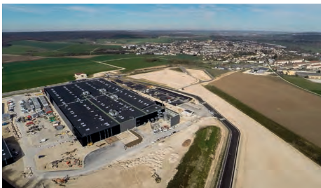
Commercy : vue aérienne du site en travaux.