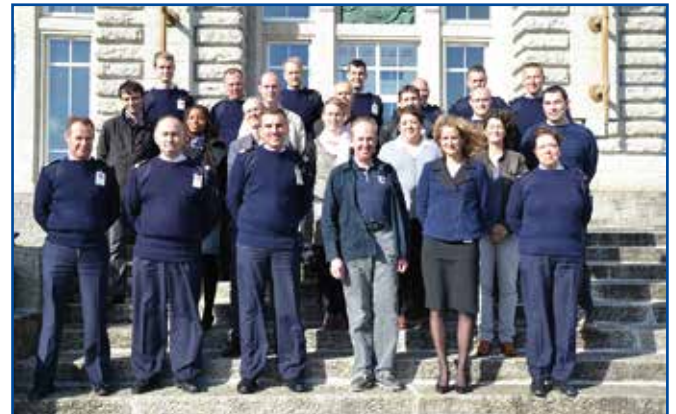
L'ensemble des cadres de l'École des mousses entourant l'amiral Forissier

Il a paru également nécessaire aux professeurs d'appuyer leur enseignement sur une ouverture plus large vers l'extérieur et de programmer des sorties, des voyages et des échanges qui donnent plus de sens à leurs cours, en particulier en Histoire, en Anglais et en Sciences. Cette ouverture permet aux élèves de mieux ancrer leurs savoirs dans une réalité et de devenir des marins et des citoyens plus responsables.