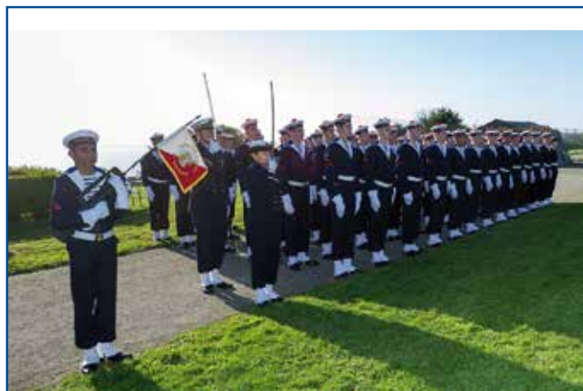
5 ème promotion de l'Ecole des mousses

L'Ecole des mousses est une école de la vie, où les apprentis marins peuvent mûrir, s'approprier les valeurs de la marine et au final faire leur, la devise des mousses : « Mousse soit toujours vaillant et loyal »