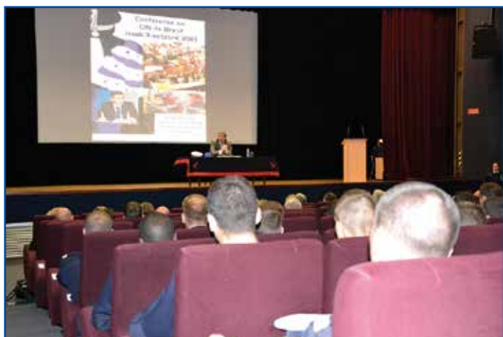
Les élèves du Lycée naval et des écoles militaires en conférence

En octobre 2013, le Centre d'instruction naval de Brest a lancé son cycle de conférences, au profit des élèves issus de l'Ecole de maistrance, de l'Ecole des mousses et du Lycée naval. Dans l'amphithéâtre Molière, des élèves des trois écoles et des