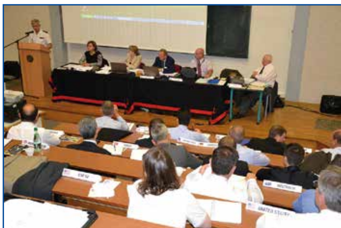
Echanges entre différents pays de l'OTAN

Le CIN Brest a accueilli du 1 er au 4 octobre 2013 un séminaire de travail sur la problématique de la Guerre des mines au sein de l'OTAN.