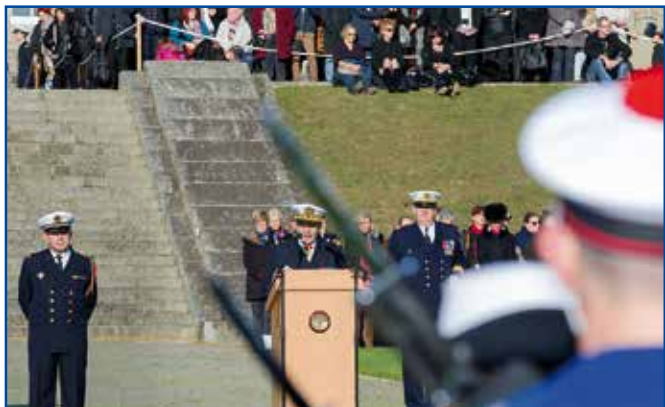
Le VAE Prazuck a présidé la présentation aux drapeaux, des écoles militaires du CIN, le 16 novembre 2013

« J'ai présidé la cérémonie de présentation au drapeau de la promotion Joseph Kerleroux de l'École des mousses. L'École des mousses est utile pour la marine. Elle a accueilli plus de 600 jeunes depuis sa renaissance, il y a 5 ans. Leur grande majorité a rejoint les rangs des quartiers-maîtres de la flotte. Elle a produit et produira des marins remarquables, comme le major Emile Hauteceur qui était à mes côtés face aux mousses. L'école des mousses est un motif de fierté pour la marine. Elle sait attirer des jeunes femmes et des jeunes hommes à ce moment, charnière pour beaucoup, qui marque la fin de la scolarité obligatoire. Elle sait leur donner un projet, une envie, une perspective, une ambition, une fierté. C'est très précisément leur fierté qui fonde la mienne. »