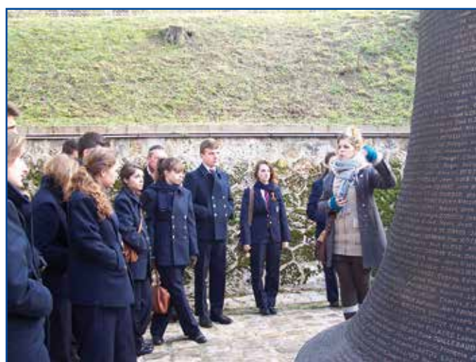
Au Mont Valérien, devant le monument dédié à la mémoire des morts fusillés par les troupes nazies en 1941-1944 et tous ceux qui n'ont pas été identifiés