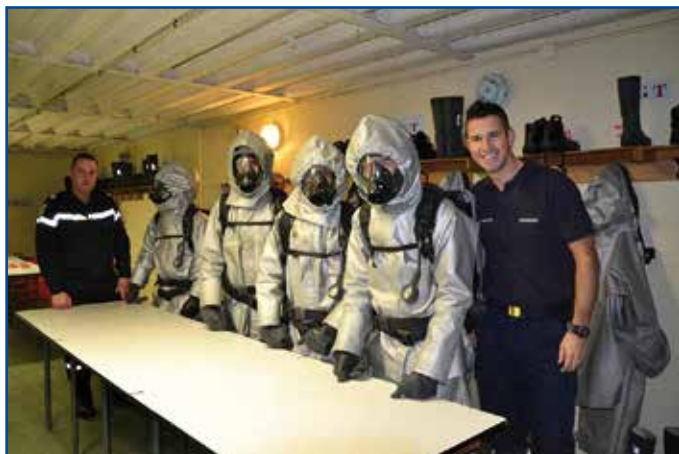
Utilisation de l'appareil respiratoire : le Triplair

Le 04 novembre 2013, une vingtaine de jeunes recrutés en qualité de volontaires marins-pompiers, pour les unités militaires de Lanvéoc Poulmic ont démarré leur formation initiale équipage (FIE) au CIN de Brest.