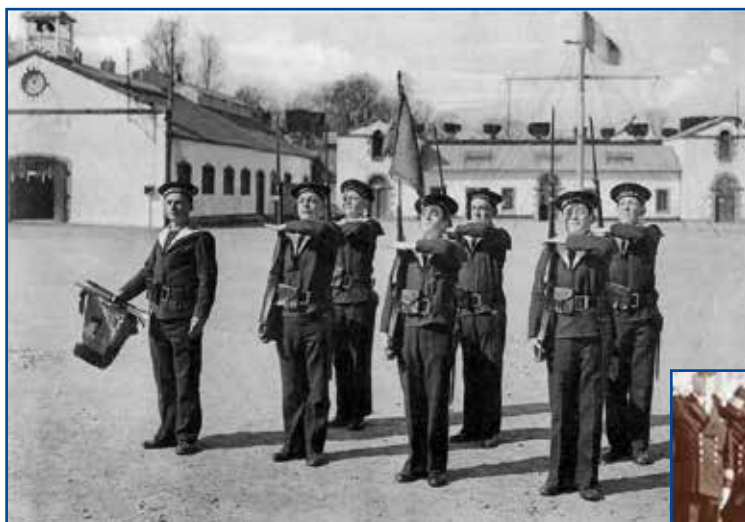
1937-1938 : fanion de l'Ecole des Pupilles-mousses

Officiellement créée par un décret impérial de 1856, l'Ecole des mousses a fourni à la marine des générations de marins qui ont constitué pendant plus d'un siècle et demi l'ossature des équipages des bâtiments de combat. Les jeunes apprentis marins sont alors recrutés dès l'âge de 13 ans et suivent leur scolarité sur des vaisseaux embossés en rade de Brest.