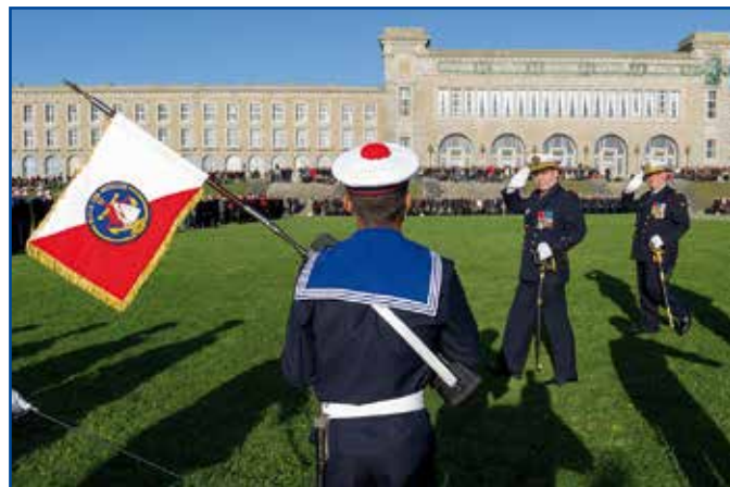
Le VAE Prazuck effectue la revue des troupes

Il les a également rassurés dans leur choix : « le splendide métier que vous avez choisi est hors du commun, il est exigeant, parfois difficile, mais il vous enrichira ».