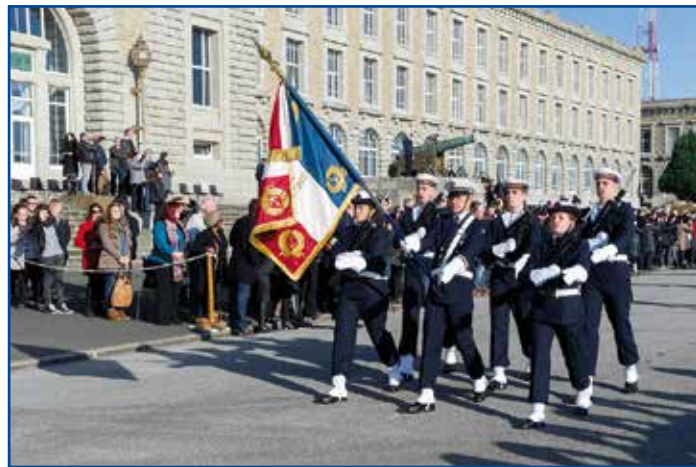
Présentation au drapeau de l'École des mousses

La promotion « Second maître Joseph Kerleroux » de l'École des mousses tient son nom d'un jeune pilote de chasse disparu en mer en 1958.