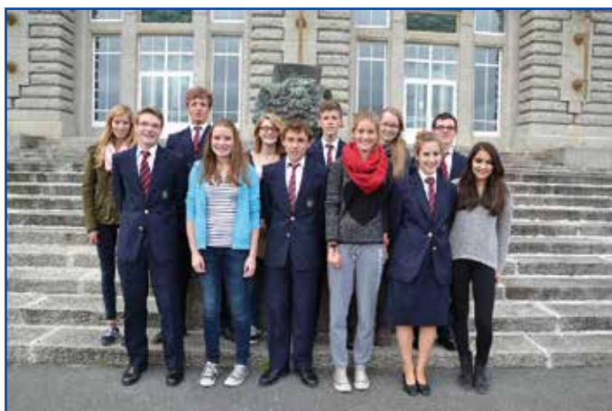
Rencontre des lycéens et de leurs correspondants du Lycée Krefeld

Dans le cadre du partenariat mis en place il y a 11 ans entre le Lycée Ricarda Huch de Krefeld et le Lycée naval, 24 lycéens allemands ont séjourné du 9 au 17 octobre à Brest, pour rencontrer leurs correspondants de classe de 1 ère et se familiariser avec le système éducatif français. Ils ont partagé les cours et la vie de nos lycéens et ont été accueillis dans les familles de leurs hôtes. Ils ont ainsi pu parfaire leur connaissance du français et approfondir leur approche culturelle de notre pays. Les occasions d'échanger dans les deux langues furent nombreuses, notamment lors des visites commentées du musée des Phares et Balises sur l'île d'Ouessant et de l'abri Sadi Carnot à Brest. Les jeunes Français seront reçus à Krefeld du 2 au 11 avril dans les familles de leurs correspondants et découvriront à leur tour l'univers scolaire et la vie quotidienne en Allemagne.