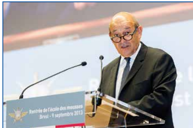
Le ministre de la défense à la rentrée de l'Ecole des mousses

« Cette école est formidable », c'est en ces mots que le ministre a témoigné de la qualité et de la nécessité de l'Ecole des mousses, qui allie un riche et prestigieux passé à la nouveauté et l'innovation. Un formidable potentiel, selon le ministre, pour les jeunes et pour la marine de demain.