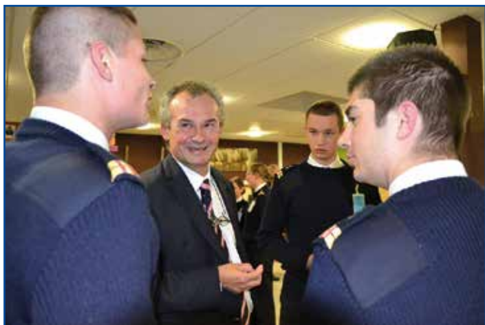
Echanges entre M. Videlaïne et des élèves maistranciers

Le 03 décembre, le vice-amiral Franck Baduel a traité de «La marine nationale dans les opérations importantes des cinq dernières années». L'auditoire a été attentif et sensible au discours du VA Baduel, abondamment illustré, notamment sur la piraterie, les guerres civiles en Afrique et le terrorisme. Son intervention a clos le cycle annuel de conférences consacré aux fonctions régaliennes.