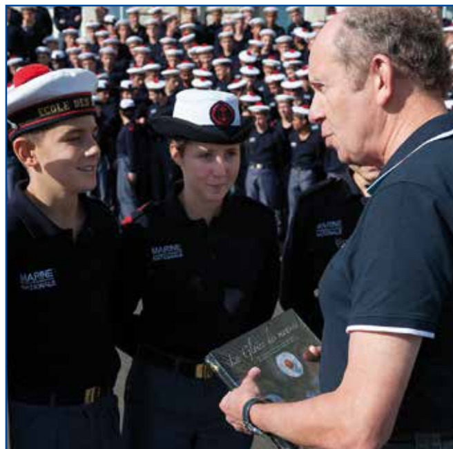
L'amiral Forissier et ses filleuls de promotion

L'amiral Forissier a témoigné auprès des mousses de son expérience de vie de marin. Il espère que la promotion fera preuve d'engagement, de volonté et de réussite. L'Amiral est venu de nouveau à la rencontre de ses filleuls, lors de la présentation au drapeau, le 16 novembre 2013, ainsi que le 14 janvier 2014, afin d'apprécier leur évolution et de leur témoigner son soutien.