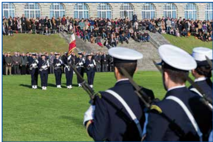
Présentation au drapeau de l'École de maistrance