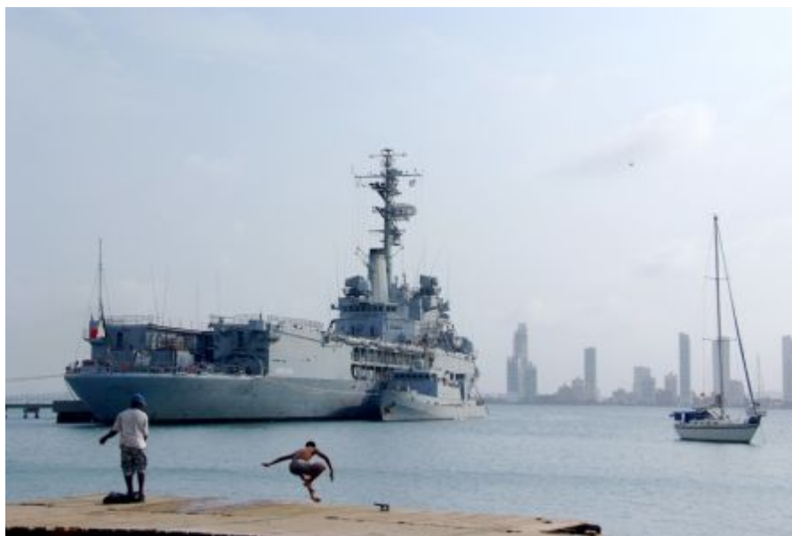
Photo prise par le lieutenant de vaisseau Stéphane Freytag : 1ère place