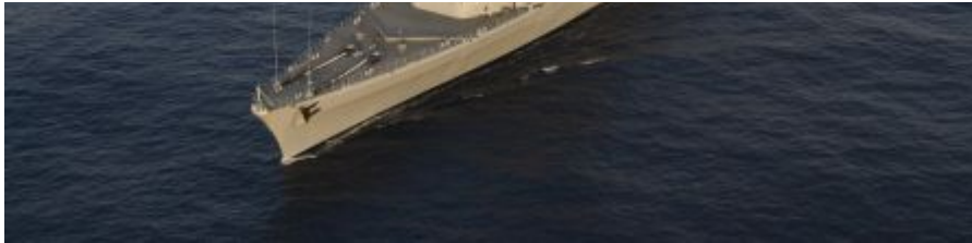
La Jeanne d'Arc à 12 noeuds, vitesse de croisière