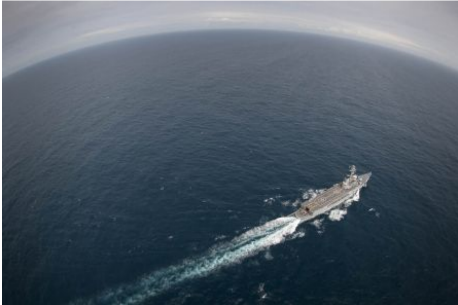
La Jeanne d'Arc à 26 noeuds !

Qu'il était beau le sillage de la "Vieille dame"; lui si souvent quasiment invisible tant le dessin de la coque permet habituellement à l'eau de glisser le long des 182 mètres sans provoquer le moindre remou.