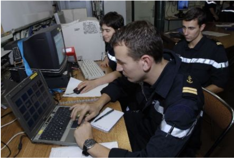
Préparation du briefing ops