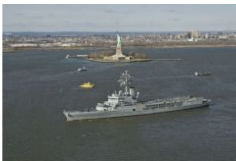
La Jeanne d'Arc devant la statue de la Liberté

La Jeanne d'Arc et le Georges Leygues ont à présent laissé les gratte-ciel de Manhattan derrière eux et voguent ensemble vers leur prochaine escale : cap sur la Martinique, où les températures estivales devraient vite faire oublier les frimas de l'Amérique !