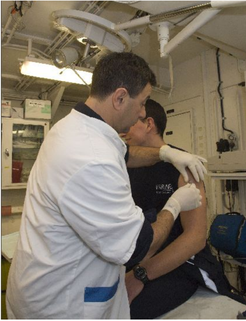
Séance de vaccination