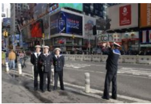
Des marins sur Times Square