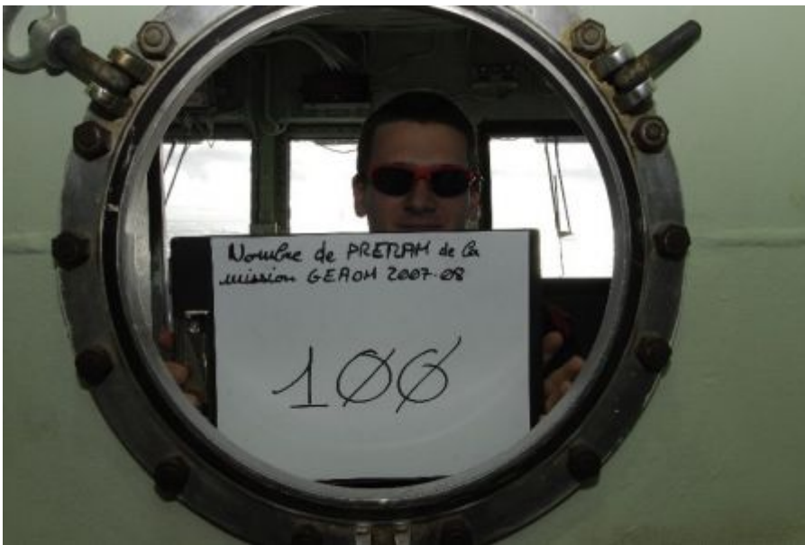
Affiche du 100ème PRERAM