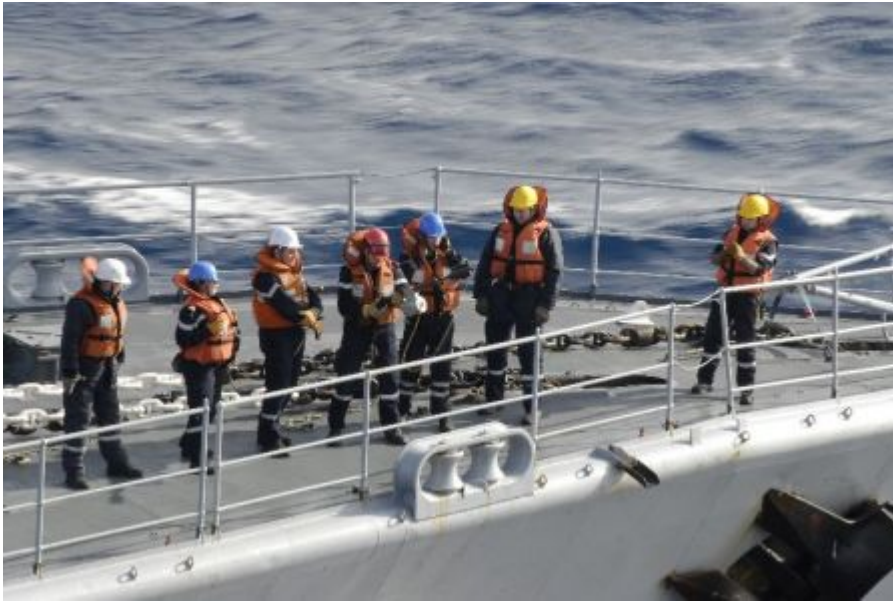
Tir au fusil lance-amarres sur le Georges Leygues