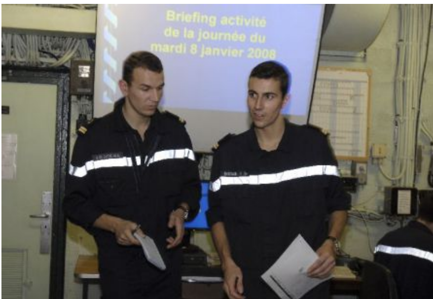
Les enseignes de vaisseau de Catryles et Bernard