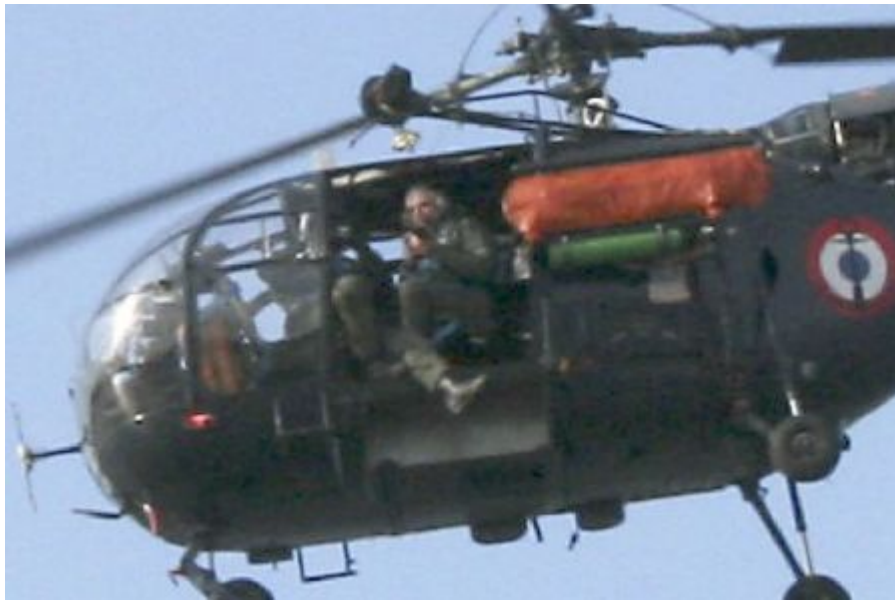
Le maître principal Le Ny dans les airs

*Le grade de maître principal se transforme parfois dans les discussions en « cipal »