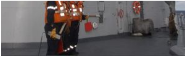
Sur la plage avant de la Jeanne d'Arc