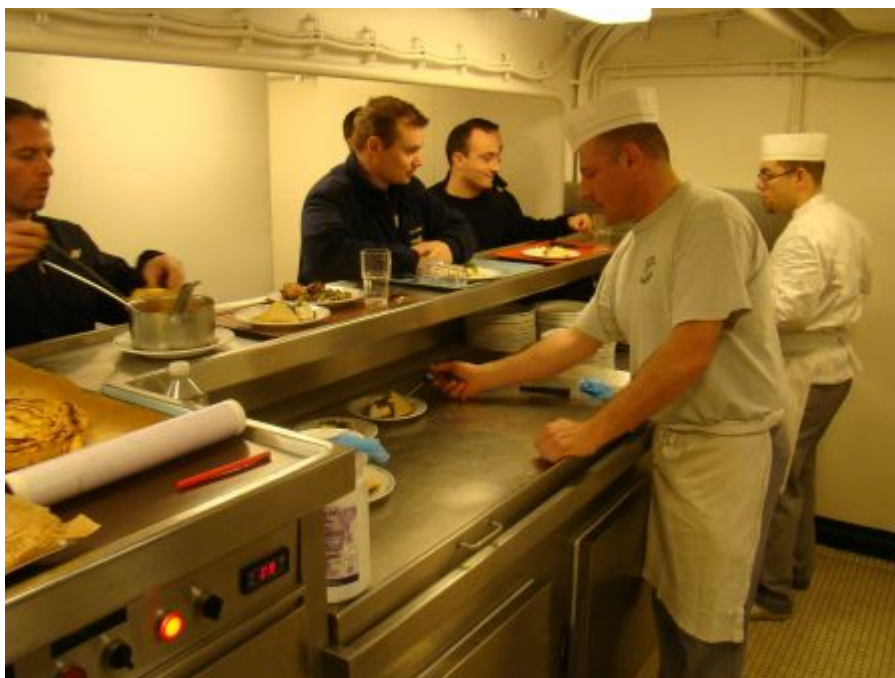
Les cuisiniers en plein service

Dans ce secteur, une bonne entente entre le maître commis et le chef en cuisine est primordiale. Ils doivent élaborer ensemble les menus, pour contenter l'équipage tout en prenant en compte les contraintes liées au stockage des denrées périssables. Fort heureusement, la bonne humeur règne et le maître adjoint vivres nous fait profiter de ses talents culinaires. Le chef contribue pour beaucoup au moral des troupes : la qualité et la variété de ses plats font le régal de tout le navire. Ce secteur est d'autant plus sollicité lors de l'embarquement de troupes de l'armée de terre doublant parfois les effectifs. En temps de paix, la Foudre a pour mission de représenter la France. A cet effet des cocktails sont organisés à bord et le service commissariat entre en effervescence.