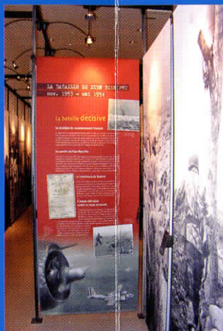
L'exposition « L'Indochine française, 1858-1954 ».

Carré de terre de 2 mètres sur 2 limité par des pierres, recouvert de gravillons blancs avec une stèle centrale surmontée d'une plaque avec inscription : « Ici ont été dispersées les cendres d'anciens combattants d'Indochine qui ont souhaité reposer près de leurs camarades Morts pour la France au cours des guerres d'Indochine ».