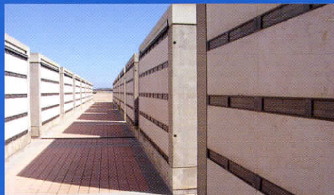
Les rangs d'alvéoles du cimetière militaire national.

Les cimetières nationaux sont réservés aux militaires. Toutefois, 3 539 civils identifiés et 79 inconnus, qui étaient enterrés à côté des militaires dans les cimetières indochinois, sont inhumés à titre exceptionnel sur le site.