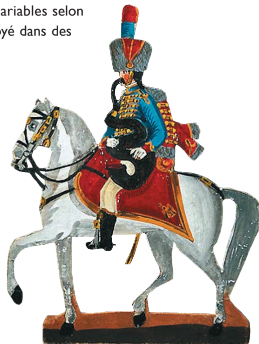
Figurines de carte