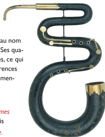
Serpent anglais appartenant au fonds instrumental et aux collections du musée de l'Armée.

Vendredi 7 octobre 12h00-13h00, Salle Turenne du musée de l'Armée - CONCERT