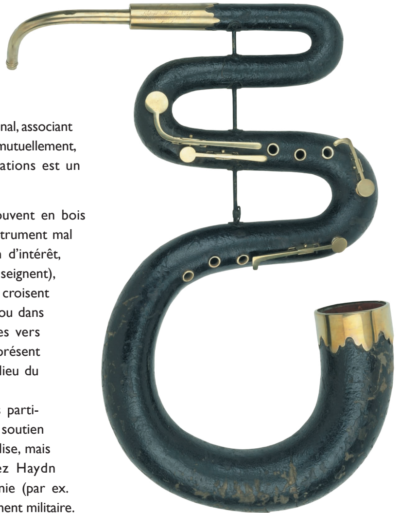
Serpent anglais appartenant au fonds instrumental et aux collections du musée de l'Armée.

Bien que sa présence soit peu perceptible dans les partitions musicales, une étude attentive montre qu'il fut soutien du plain-chant, accompagnement de la musique d'Église, mais aussi instrument de musique de chambre (chez Haydn notamment), instrument employé dans la symphonie (par ex. chez Berlioz), dans l'orchestre d'opéra et enfin, instrument militaire. Il s'agit donc de faire un point sur cette diversité d'utilisations, sur ses origines, sur son iconographie, autant d'approches qui seront complétées par des études sur les particularités acoustiques et organologiques de l'instrument.