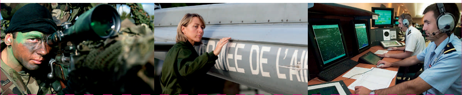
TABLEAU DES MÉTIERS