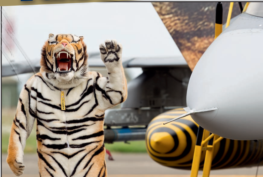
Fin de l'exercice. Le Nato Tiger salue une dernière fois le public cambrésien.