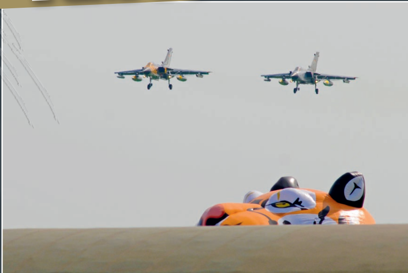
Prêt à bondir, un tigre guette l'arrivée des deux Tornados du Jagdbomberstab Affel 321 allemand.